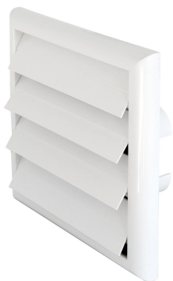
Grille "SU1818B" de surpression en ABS