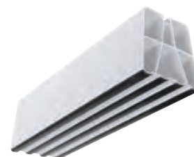
vue des joints moulés