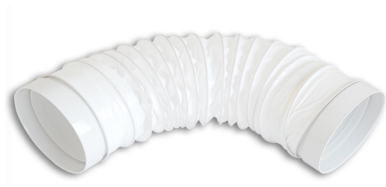
Coude rond flexible FF