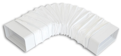
Coude rect. flexible FF