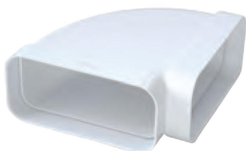
CCO126B CCO157B CCO229B